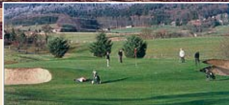
18-Loch Golf-Platz mit Blick auf Altenschwand und den Tannenhof